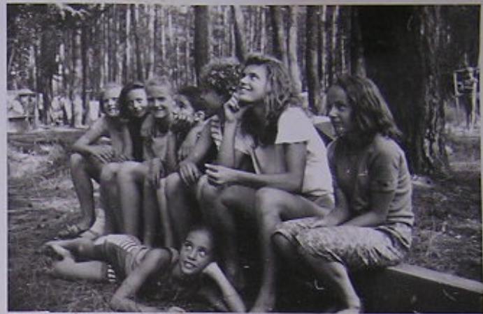
DĚVČATA ZE ŽLŮNA NEBRÁCEJÍ NIKDY DOBROU NÁJADU.