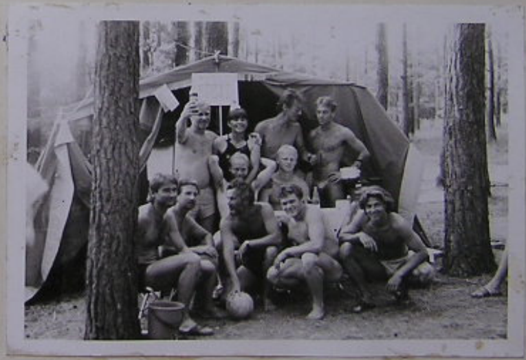
ČÁST NAŠEHO FOTBALOVÉHO TÝMU PŘED BUIPETEM PEGAS , KTERÝ NĚDE MILA BASOUNÍKOVĚ.