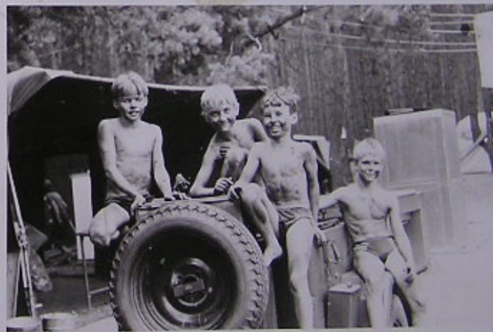
A ŽDE JE VÝSLEDEK - ŽLÍNŠTÍ 'MOUŘENÍ' V AKCI !