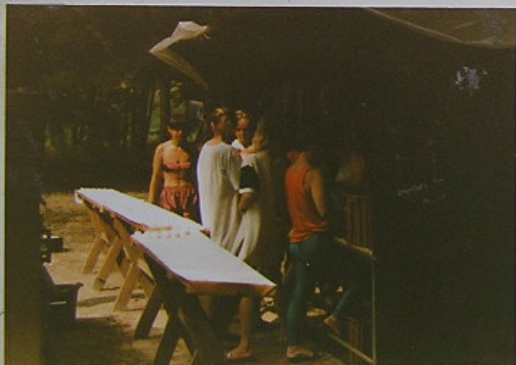
DOKTORKA BUIČKA KONTROLUJE ŽIA JE ! PŘI TĚTO PRÁCI DODRŽOVÁNA HYGIENA .