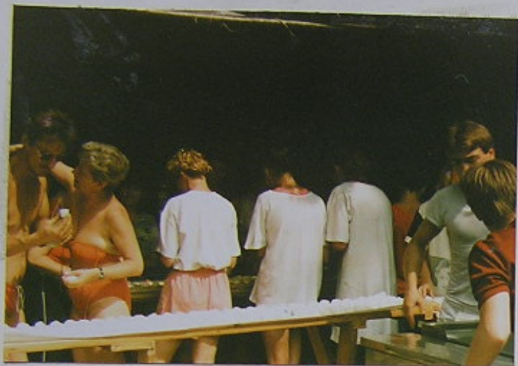
A DĚLÁM SE KULIČKĚ (OVOČNĚ KNEDLÍKY) JÁKŮŠ, HÝŽALOVÁ, ŠEDĚNKOVÁ, KUJAN A POKLÍ TO JE OSROVSKÁ MANUFAKTURA !