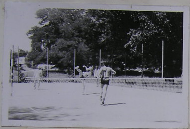
ATMOSFÉRA JAKO ŘEMEN. FASBENDER NA SAKU = NEBEZPEČÍ PRO SOUPEŘE!