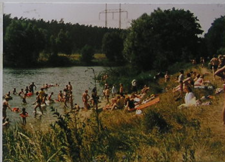
SOBONKY NAŠE ! ZACHOVEJTE SE NĚM A VESNŮ V TĚTO PODOBĚ ! PRO NÁS I NAŠE NĀSLEDOVNÍKY !! POTŘEBUJEME VÁS !!!