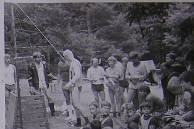
VETERÁNI SE PŘIPRAVUJÍ KE CVIČENÍ NA HRABOVĚ.