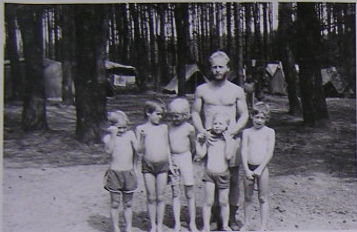
VRAŤA ŘEZAČ SE SVÝMI ZBOJNÍKY.