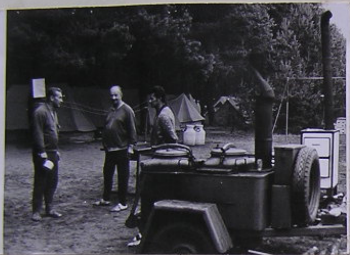
KARLE, TĚCH NUDL BYLO MOC! ŘEKA SVATÝ NOVOTNÝ KUCHAŘI KRBOVÍ. ŘEKA "PRŮHŮŽI".