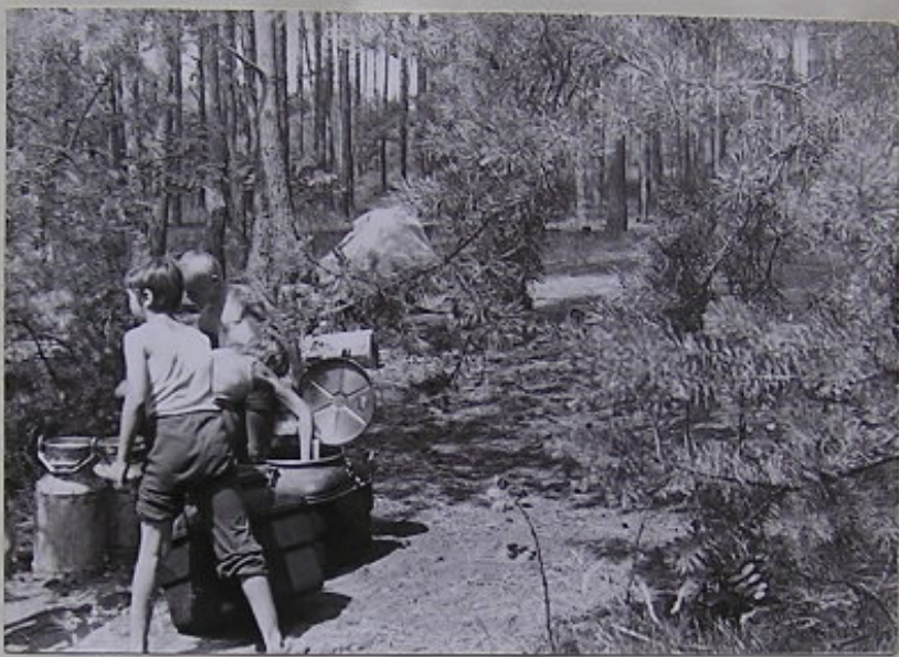
A OPĚT BOREM ZE ŽIVNA V AREA TENTOKAŽ IDI NEPOPULÁRNĚM "VÝPLACHU" TONIKA. VEVO LEGENDÁRNÍ REKRETAČNÍ KONVE NA ZBYTEČKY.