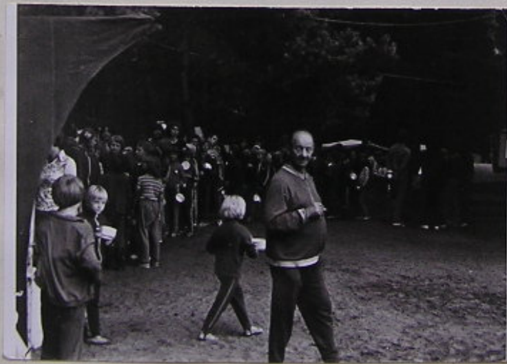
TO BY MĚ ČERT SEBRAL, KDOŽ TY DĚČKA NEDOTYKAT! Víte řka. F. NOVOTNÝ