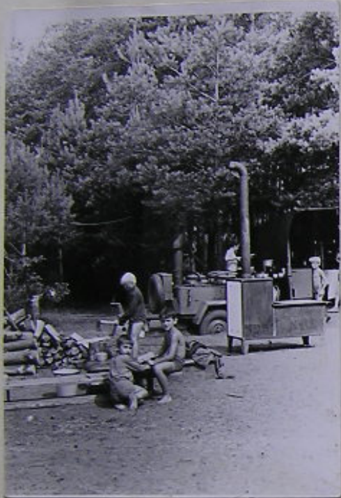
FÖRSTER, ORLÄNDER, MENDLIK U DALI. TO BILA MARTA, Z MLHĚ SE UTVILKO POZPĚZI I ZLATO NA NEBOHU ČER. A MARTIN SE HRÁL SE SEKEROU UŽ OD MALIČKA.