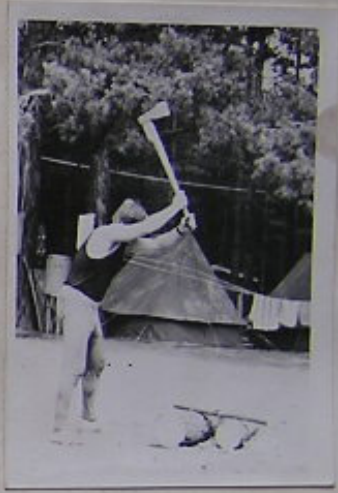
JARPO, NESERNI SE! TRAVNÍ SPRAVITEL "HATVÁT" Z ARASU JE OUVĚT VIRTUOS (A TO NEJEN V TĚTO OBLASTI !