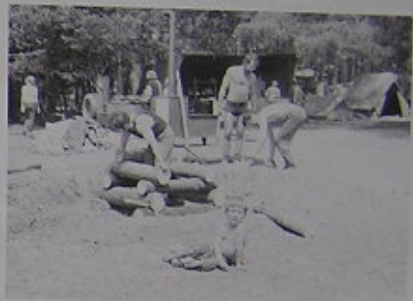
MALÝ SNĚHEČEK, ALG CENŮT. DIĚT SE STAVÍ "PAGODA" A PROTAGONIST ŮŽ URČITĚ POZNÁTE SAKU!