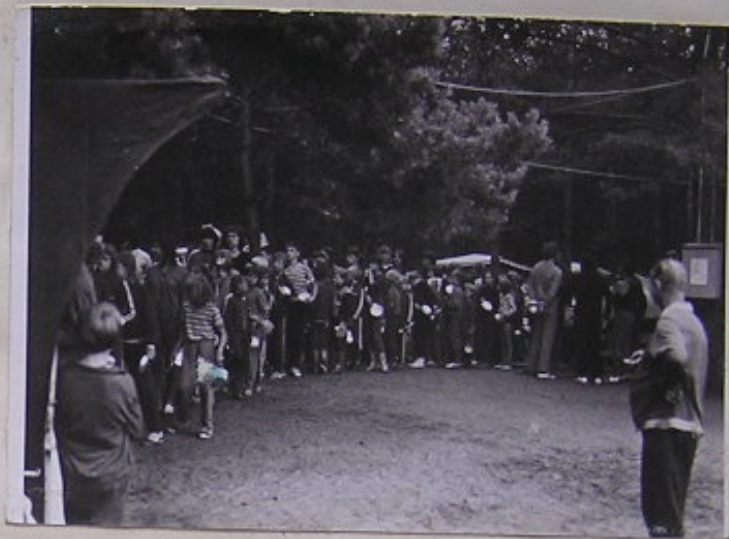
TAK TO JE KLASICKÁ ŽÁŘE!! TAK TO ŘEKA UČITEL S OBUBOU KONTROLOVAL.