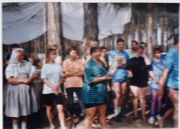
PLADĚNÁ KETČUPÁ PĚŠIČKA PAMĚŤŮM VÁŠU NA MOTORÁKU, LETOS BYLA JINÁ DEKORACE !