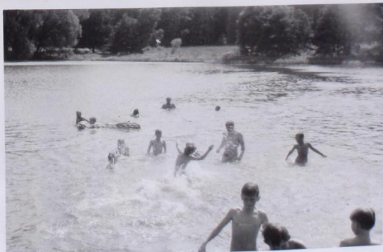
PŘI TĚCH VEDRECH (AŽ 34°C) JE U VODY VĚDYCKY BEZVADNĚ !