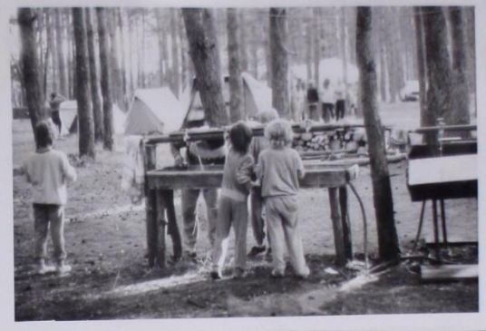
POHLED NA TÁBOR „OD NAŠEHO VODOVODU“