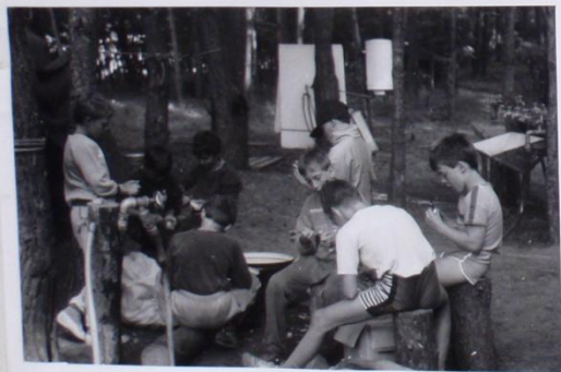
"MAŤ ŠEVCI" - SLOUŽÍCÍ MOMENTÁLNĚ V KUCHYNI