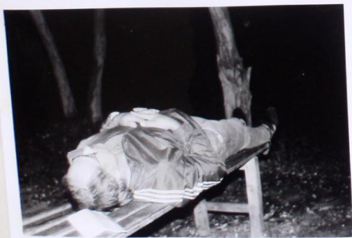
...A ŘEDITEL SE U OHYŇKU OPĚT HO DIL DO SVĚ PŮVĚSTNĚ LIBELJ."