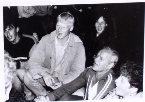
ŘÍŠA, MARTIN, "MIKULŠKORO VEJŠIE DĚCKO", VATEK HOLBAK A NAJA MAFICA TO PROŽIJÍ NA ÚROVNI.