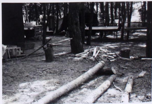
KLASICKÉ SOBŇSKÉ ZATĚŠŤ.