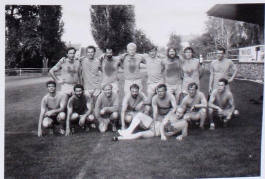
1: 78- NO, SOUPEŘ BYL LEŠTÍ, ZKLAHÁM SE ZTRACÍ, PŘÍŠTĚ TO MUSÍ BYT LEŠTÍ. CO UY NA TO, CHLAPI 2: 1: 8 SE NEBUDE OPRAKOVAT! NEBO SUDŮ 9 NO ?