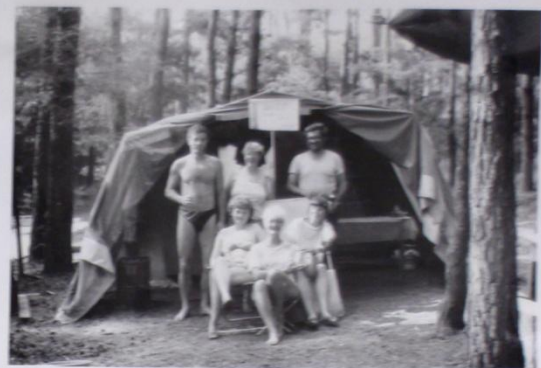
V POLEDNÍ TAVĚ PŘÍJDE KE SLOW I ODLIBENÝ BIFET DVO Z VALHALL - PĚTA I KMOČENKA, ŽUŽŮ, DRAMA, LUVĚLA A MILA PŮVODI PRO FOTOGRAFA.