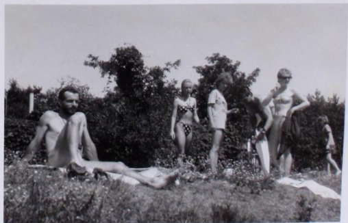
HONZA KOMESE SE "ŠEPEŇKOU" SLEDUJÍ BEPLIVĚ SVĚ, NADEŠE' PŘI KOUPÁNĚ.