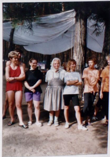
ZJEVNĚ DOBRÁ NÁLAGA PŘI NAŠEM "MEMORIÁLU" ŘADA Z VÁS SE FODNÁ, ŽE ?