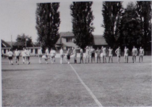
NASTUPJEME VE FOTBALOVĚM CHTĚTÍ V RATŠKOVICÍCH PROTI INTERNACIONÁLNÍM BANĚKŮ. TO JSME NEVŠLI, JAK SE DO NÁS DOMÁŮ OBŮJÍ.