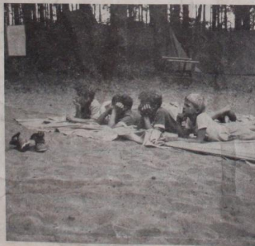
Čivile odpočinku po náročném tréninku.