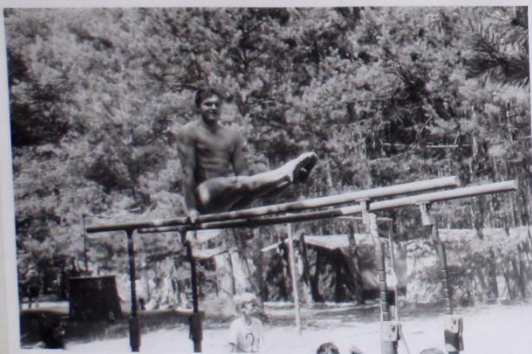
HAMBOS o - JAKO VĚT NA BRADLECH - PŘESVĚDĚNĚ " A S ÚSMĚVEM. BUDEME VĚDĚLAATEL TĀBORA, MYNĪ, ČESTOVATEL "