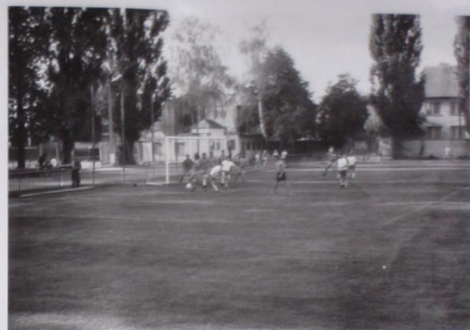
ZÁVAR PŘED NAŠÍ BRÁNKOU, TENTOKRÁT JSME JEŠTĚ OPOULALI.