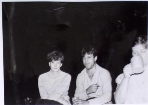
DALŠÍ VŘACNÝ HOST - VĚDY NAŠE JITKA KROČOVÁ V PĚCI BŘETĚ MIKULŠŤA.