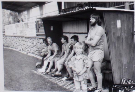
SMUTNÁ LAVIČKA LVT SG. TRÉNĚRŮ ŘEŠÁČ A ŽOUŘELÁ USTARANÍ, RÁDEK TAKT, SPOKOJENÝ JE ZŘECHŤ JEN MALÝ PĚTĚTĚK.