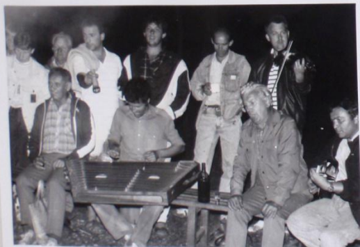
MOŘSKÝ SBOR VLAČAVSKÉ CIMBÁLOVKY JE VEŠTĚ MILÝM ZPĚSTŘENÍM.