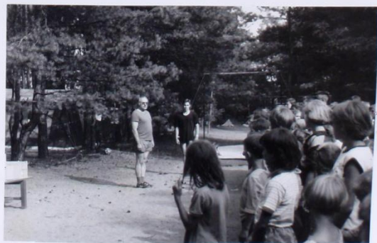
REPRESENTANT VILKA FIRT PŘEDAL PRÁVĚ HLÁŠENÍ REPITELY TÁBORA O. RIESSIGROVI.