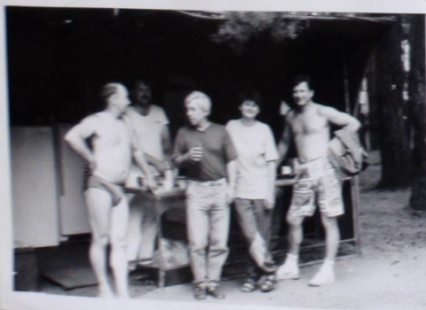
KUCHAŘI S OBĚMA VADY. HEZKÝ ŽABŮK, BO KILÉTE ?