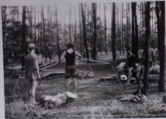
TAK, ZUŠŤ SOKOLÍCI - JAKPAK TO POSTAVÍTE ?