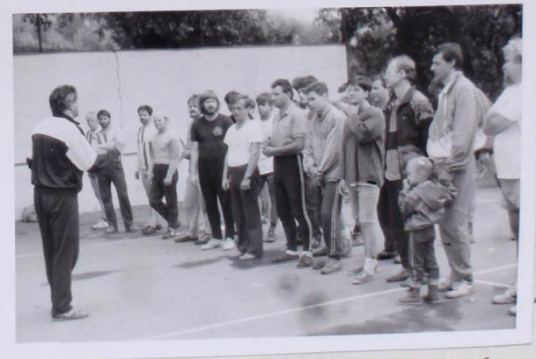
POZOR ! LOSUJE SE „NOHEJBALOVÁ NĚDĚLE“ NAPĚTÍ VE PATRNĚ. VĚK BODU MALOSOUKALY SKUPINY ? LETOS SPARTOVÁLO (12) CELKŮ !!