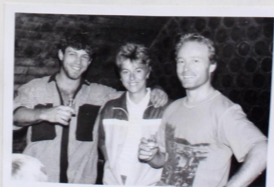
JÓ, I GAJDIKŮ, TAM JE JEJĚ ŠPATNĚ VÍTKO NIKDY NEMLU. BĚŽĚ, AMĚRA A VRAŽA TO SUJTI SPOKJENĚNĚMÍ VŠMĚV NEV POUVZDŮ.