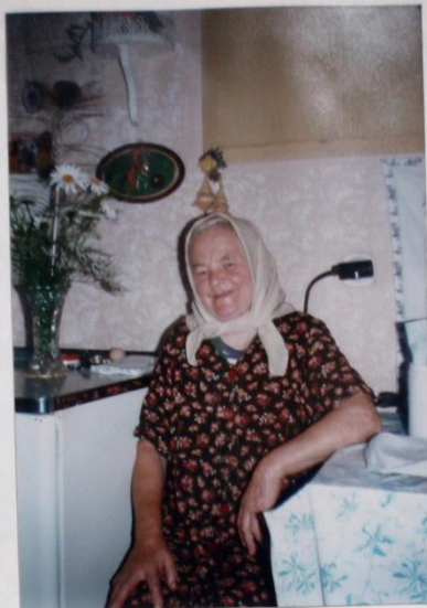
NAŠA TETČKA - SNOPKOVÁ, VE SVĚ KUCHYNĚ, KDE SE ZASTAVIL ČAS. JAK ŽIVÁ, JEN ŽI POHLADIT !! TAKŽE, TETI, HODNĚ ŽPRAVÍ !