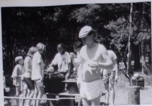
TAK CO, TONDO, CHUTNĀ, CHUTNĀ ?