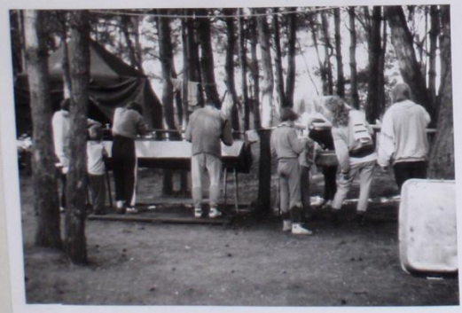
PRŮVĚ PROBĚHA RANNÍ „HYENA“