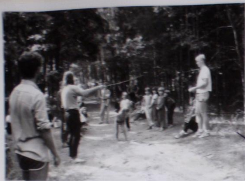
ATLETICKÁ BULHARŮ - PEDAGOG STESLA NĚKON DNE METODICKY, ALE ODHODNŮV JÁŘE MÁVĚ ŽŮSKY NEVĚTĚ MÁVĚ EXCELENTNÍ.