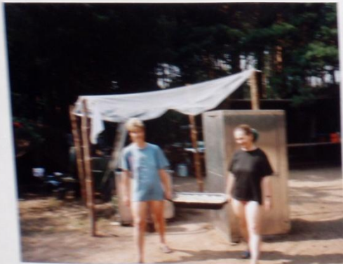
ŽÁKŮ VE SVĚŽÍ, AŽBY DŮE "DŮE VĚŠKY ANIČKA" LINDRA V AKCI.