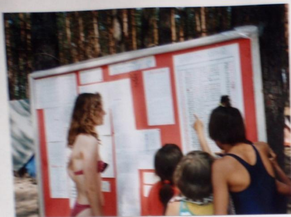
MÁMĚ HOU BÝT O VŠECHNĚCH SVĚTO SVAZU INFORMOVANÁ, ŽE ZABINKO ?