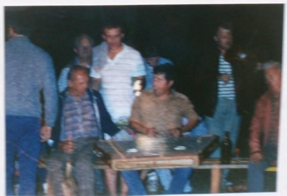
OBRAZOVKA M. KOCIANKA VĚŠKY. JEDNO ROZDĚLÍ ŽÁKŮ.