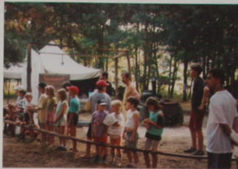
„TO KOUKÁTE, TO KOUKÁTE, CO DNES BUDE K OBĚDU“