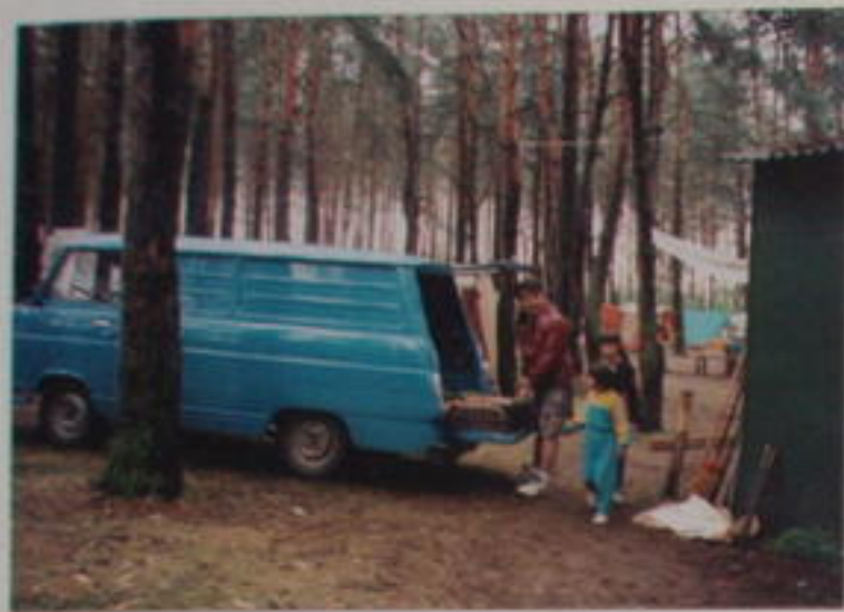
ZÁSOBOVAČ OTTO RIESSLER.