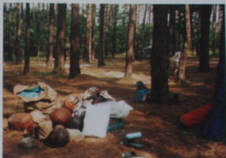
STATNÍ CHLAPÍ VĚCI NALOŽÍ A ODVEZOU.