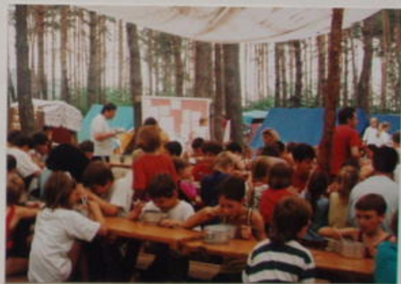
KOUKAL I ŠTÁB ČESKÉ TELEVIZE BRNO, KTERÝ PŘIJEL NA SOBOŇKY NATOČIT PÁR ZÁBĚRŮ ZE ŽIVOTA TÁBOŘA. DĚTI SE MOHLY VIDĚT HNED PO NATOČENÍ. SESTRÍHANOU REPORTÁŽ SLEDOVALI DIVÁCI V „JM VEČERNÍKU“.