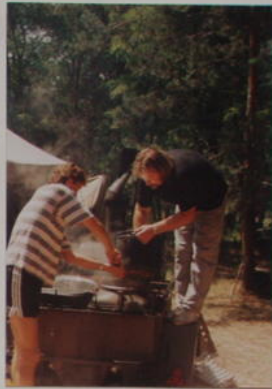
KUCHARŮ „KALO“ A JEHO POMOČNÍCI.