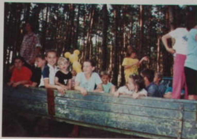
SPOKOJENÉ A USHĚVAVĚ GYMNASTKY ODDÍLU VALHEZ